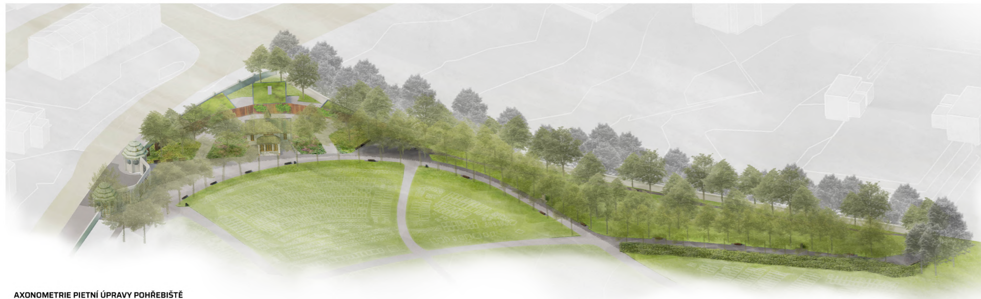
AXONOMETRIE PIETNÍ ÚPRAVY POHŘEBIŠTĚ