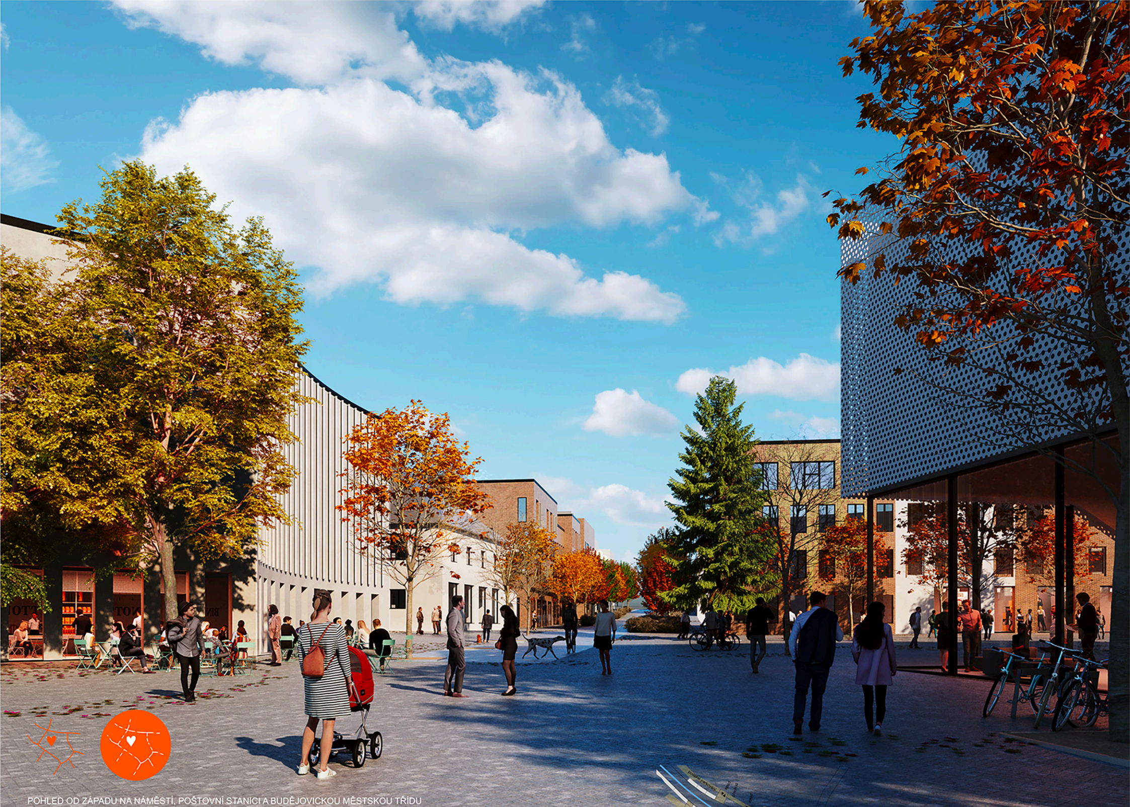
POHLED OD ZÁPADU NA NÁMĚSTÍ, POŠTOVNÍ STANICI A BUDĚJOVICKOU MĚSTSKOU TRÍDU