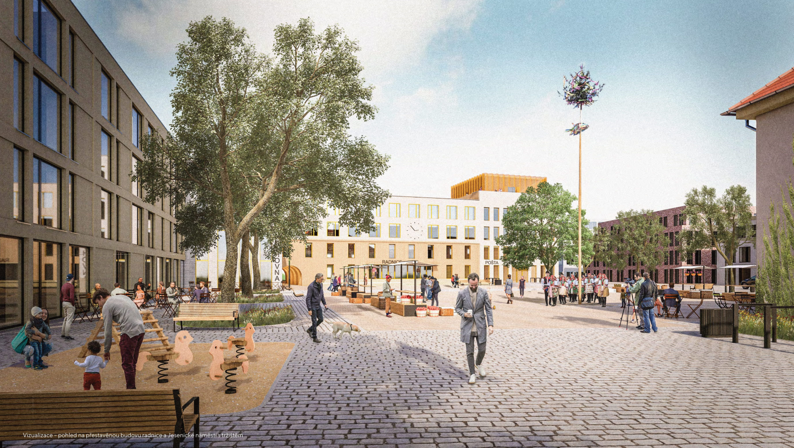
Vizualizace – pohled na přestavěnou budovu radnice a Jesenické náměstí s trzistěm