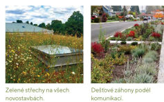
Zelené střechy na všech novostavbách.