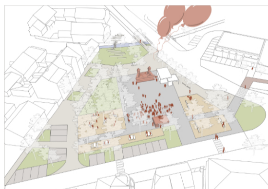
pátek 2.6. Včera byl Den dětí, slavíme!