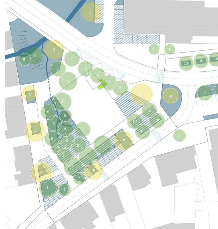
SCHÉMA MODROZELNÉ INFRASTRUKTURY

K náměstí přistupujeme s respektem a cílem zachovat pro další generaci ucelenou plochu s minimálními požadavky na provoz a na péči. Primárně podporujeme přirozený odtok z území využitím spádování zpevněných ploch a maximálním zasakováním dešťových vod. Výběrem vhodného sortimentu stromů zejména z domácích druhů snižujeme zranitelnost městské zeleně vůči dopadům klimatické změny.