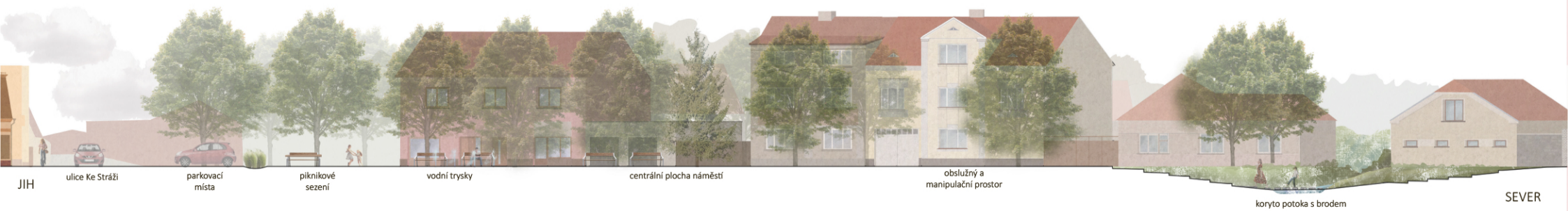
JIH ulice Ke Stráži parkovací místa piknikové sezení vodní trysky centrální plocha náměstí obslužný a manipulační prostor koryto potoka s brodem SEVER