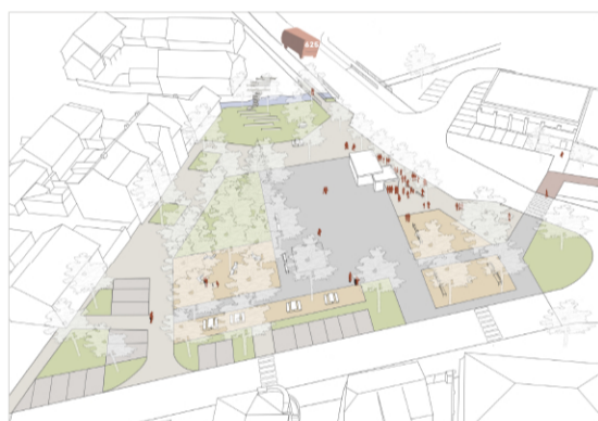
pondělí 7:27 Kde je ten autobus na Kladno?