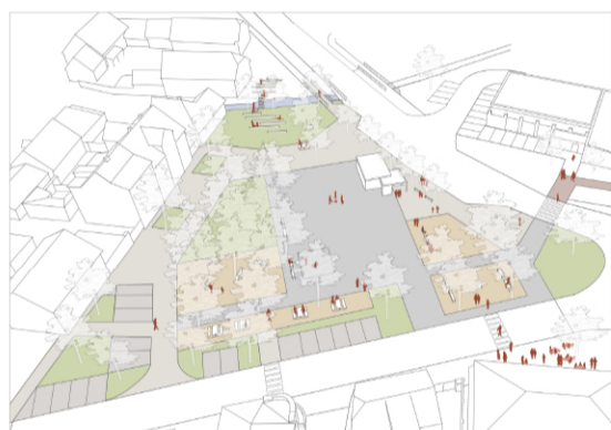
středa 15:32 Půjdeme na zmrzku?