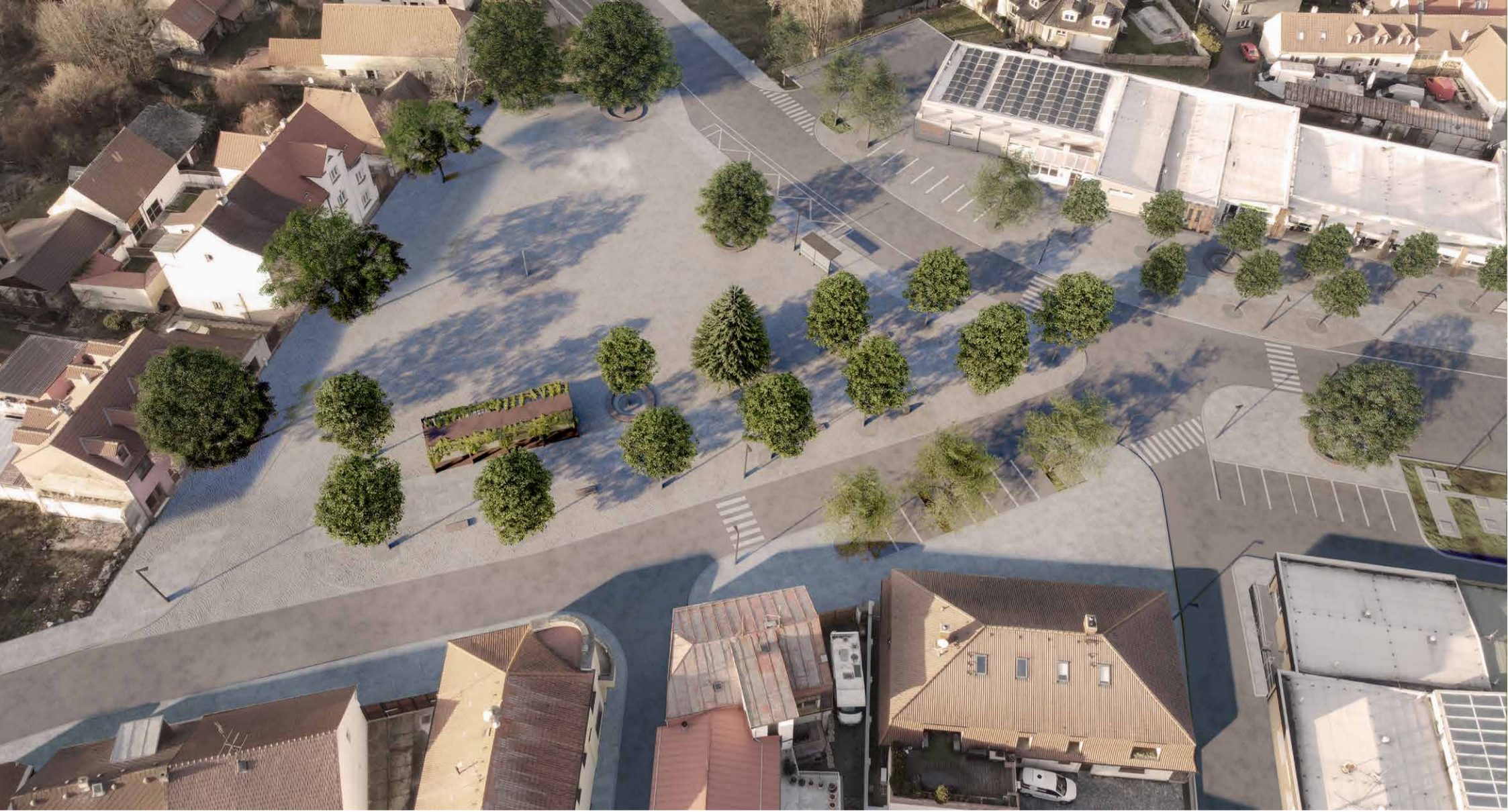
ŘEZA - A'