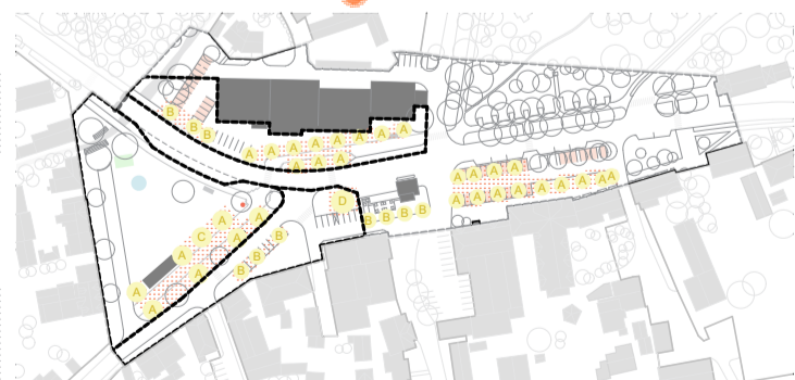
SCHÉMA ZELENĚ NAKLÁDÁNÍ S DEŠŤ. VODOU