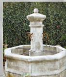
Tradiční kamenná kašna a kamenný blok s vodním prvkem