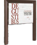
Informační tabule, typ Chamonix, Metalco